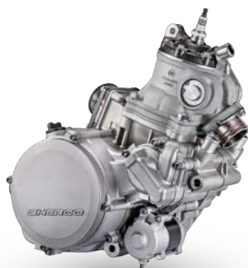
2T STROKE 125