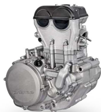
4T STROKE 250-300