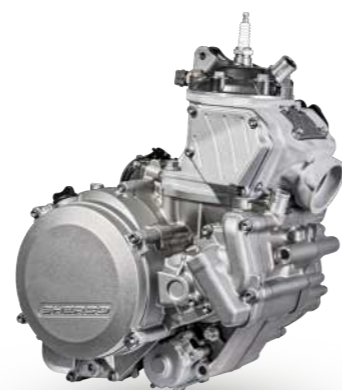
2T STROKE 250-300